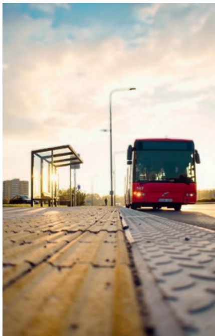
Leerstellen: Zur Absicherung des Deutschland-Tickets müssen noch viele Fragen beantwortet werden:

Das derzeitige Einnahmeaufteilungsmodell – das sogenannte Leipziger