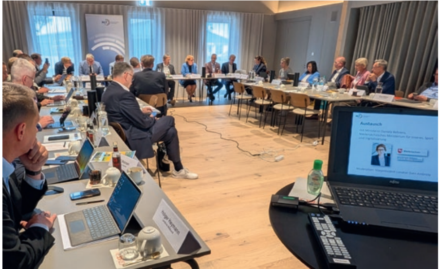
Prägendes Thema: Die Kommunal Finanzen standen im Mittelpunkt des Austauschs mit der Innenministerin bei der Klausurtagung der Landrätinnen und Landräte.

Breiten Raum nahm schließlich die Diskussion zur Zivilverteidigung ein. Angesichts internationaler Krisen und wachsender Sicherheitsbedrohungen stellte die Ministerin dar, wie man sich auf die neue Gefahrensituation einstelle. Niedersachsen werde die Landkreise als untere Katastrophenschutzbehörden stärken und