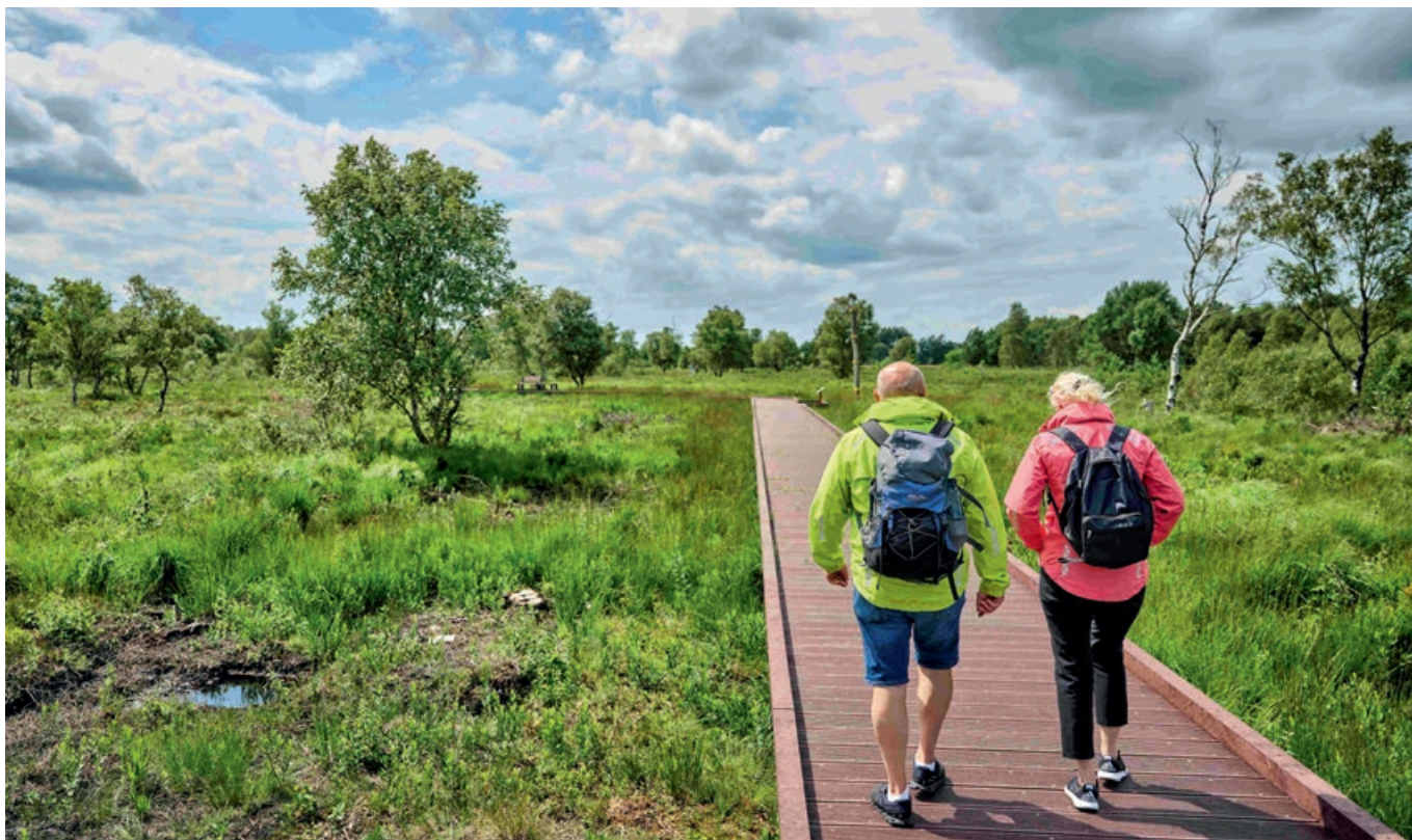
Nachhaltige Entwicklung der Moorlandschaften: Einbezogen sind Tourismus, Umweltsensibilisierung und Landwirtschaft.

Mehr Informationen: https://moorregion.de/