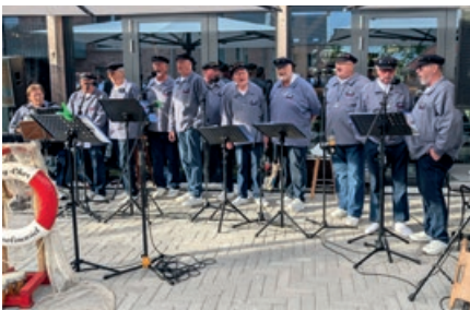
Schmissiger Auftritt: Ein Kurzkonzert des Shanty Chors Carolinensiel sorgt bei der Klausurtagung zumindest kurzzeitig für Schunkeln und gelöste Stimmung.