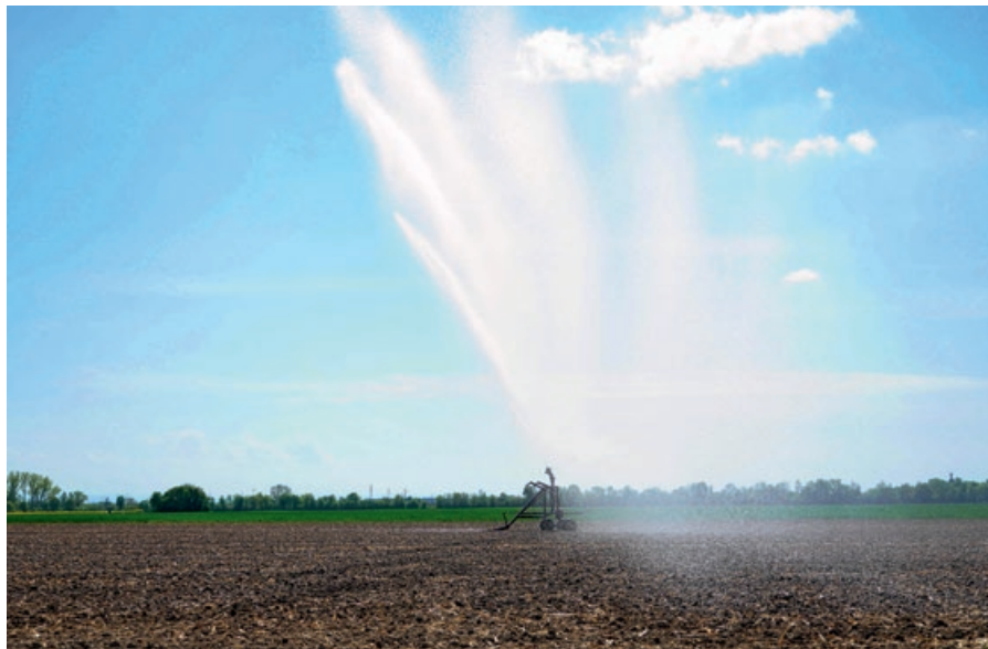
Herausforderungen des Klimawandels begegnen: Novelle des Niedersächsischen Wassergesetzes bringt Änderungen auch bei der Erteilung von wasserrechtlichen Erlaubnissen zur Feldberegnung.

Der Gesetzesentwurf sieht unter anderem eine Anzeigepflicht für bestimmte Wasserentnahmen sowie eine Risikobewertung bei Grundwasserbewilligungen vor. Außerdem sollen Beregnungsverbände und der Schutz von Trinkwasservorkommen gestärkt und ein Hochwasserschutzregister eingeführt werden. Das Bestreben des Landes, den unteren Wasserbehörden zusätzliche Instrumente an die Hand zu geben, um den Herausforderungen des Klimawandels besser begegnen zu können, ist grundsätzlich zu begrüßen. Allerdings werden einige Regelungen aus Sicht