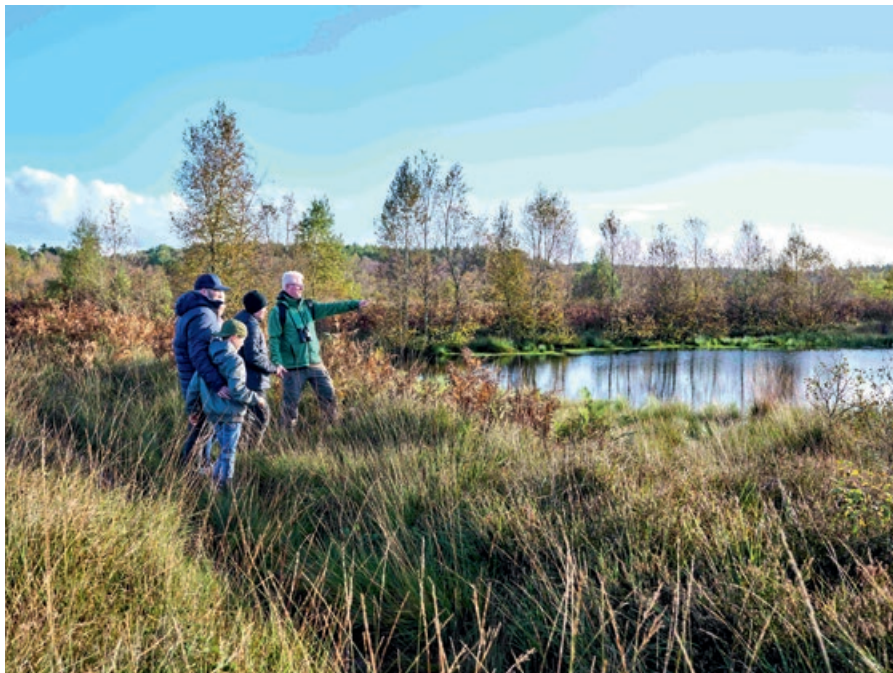
Verbindendes Element im Elbe-Weser-Dreieck: Moore prägen Landschaft, Kultur und Klima und eröffnen Potenziale für Entwicklung, Tourismus und Klimaschutz.

Konkret möchte die Region die Moorlandschaften als Motor für nachhaltige Entwicklung nutzen, erhalten und pflegen. Dabei sollen Transformationsprozesse insbesondere in der Landwirtschaft angestoßen sowie der