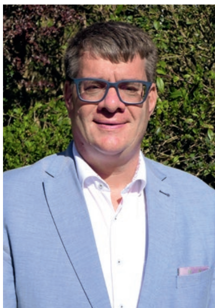
Dr. Joachim Schwind, Geschäftsführendes Präsidialmitglied des NLT.

In dieser schwierigen Lage mit düsterer Prognose betreibt die Landesregierung einen Gesetzentwurf zur Novelle des Niedersächsischen Finanzausgleichsgesetzes, dass ausschließlich Verschiebungen zwischen der Gemeinde- und der Kreisebene bei den Zuweisungen für die kommunalen Aufgaben vorsieht, also den horizontalen Finanzausgleich betrifft. Die kommunalen Spitzenverbände haben einmütig und geschlossen in einer gemeinsamen Stellungnahme gegenüber dem Innenministerium darauf gedrungen, dass die flächendeckend und überall vorhandenen kommunalen Finanzprobleme, die sich in den aktuellen Haushaltsplannungen mehr als deutlich zeigen, vom Land endlich adressiert und gelöst werden (siehe dazu Bericht S. 125).