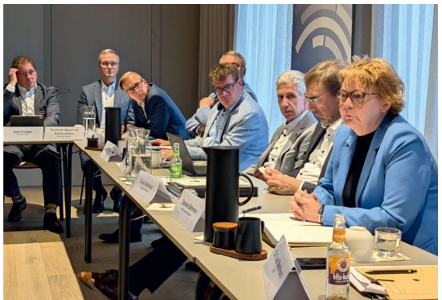
Konzentriertes und offenes Gespräch: Austausch der Landrätinnen und Landräte mit Innenministerin Daniela Behrens.

Seitens der Kommunen bestand Konsens, dass das Härtefallverfahren nicht zu einem „zweiten Asylverfahren“ werden dürfe. Diskutiert wurde auch die Frage, ob ein sogenannter Spurwechsel für die Überführung abgelehnter Asylbewerber in den Arbeitsmarkt möglich sei. Die Ministerin verwies auf die letztlich ohne Ergebnis geführte Debatte auf Bundesebene.