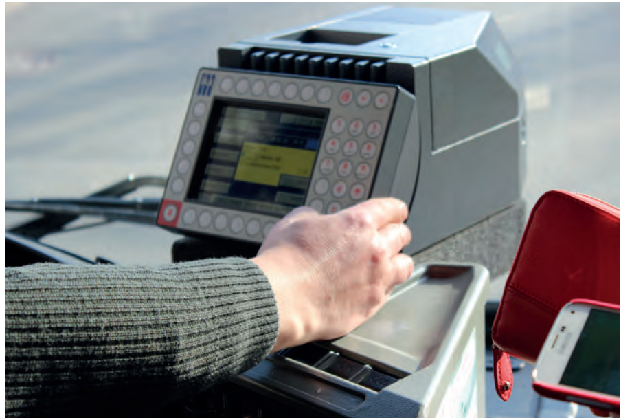
Der ÖPNV wird für Kommunalpolitik transparenter.

Von den übrigen Verbandsvertretern wurden im Wesentlichen die von Verkehrsunternehmensseite befürchteten massiven Auswirkungen auf die in Niedersachsen fahrenden privaten Verkehrsunternehmen beklagt. Mit dem Gesetzentwurf werde das Ende