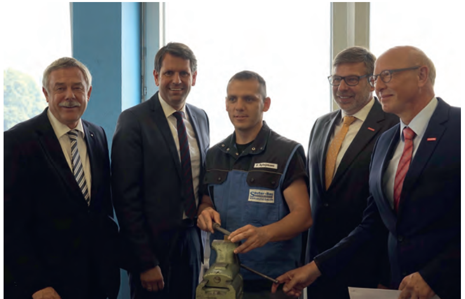
Wirtschaftsminister Olaf Lies (zweiter von links) stimmte einer Verlängerung des Projektes zu.

Seit November 2015 wurden in den Handwerkskammern mehr als 1.000 Beratungen für Flüchtlinge und ausbildungsbereite Handwerksbetriebe durchgeführt. Insgesamt konnten 340 Flüchtlinge in den Bildungseinrichtungen der Handwerkskammern und in Betrieben ihre Eignung für