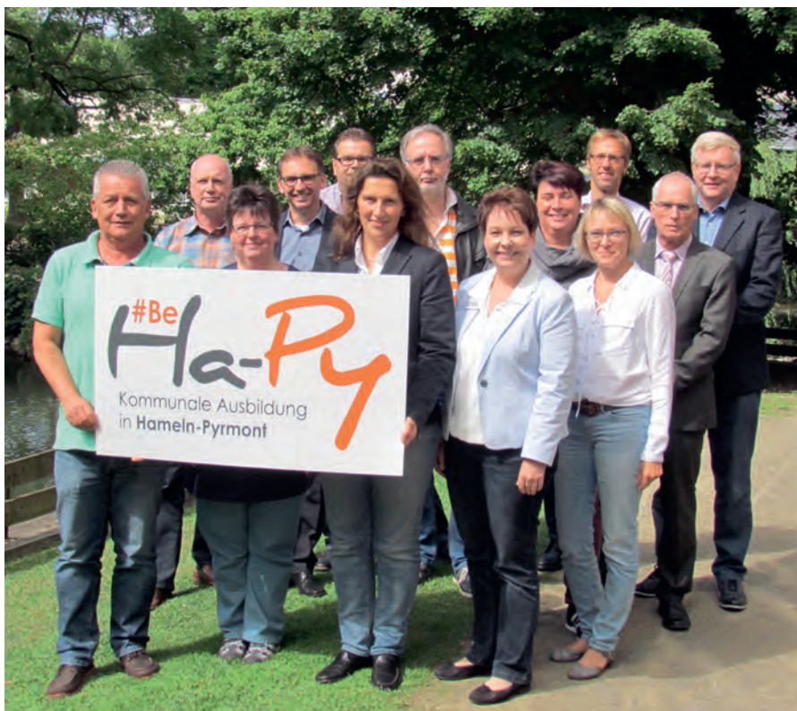
Ein Beispiel interkommunaler Zusammenarbeit ist das Netzwerk „Be-Ha-Py“ im Landkreis Hameln-Pyrmont.

Ha-Py“ stellt sämtliche Ausbildungsberufe und seinen dualen Studiengang Bachelor of Arts (B. A.) mit den Fachrichtungen Public Administration & Public Management informativ im Detail inklusive der Angaben zum Einkommen vor und gibt einen Überblick über freie Ausbildungsstellen in den jeweiligen Rathäusern bzw. im Kreishaus mit den dazugehörigen Kontaktdaten.