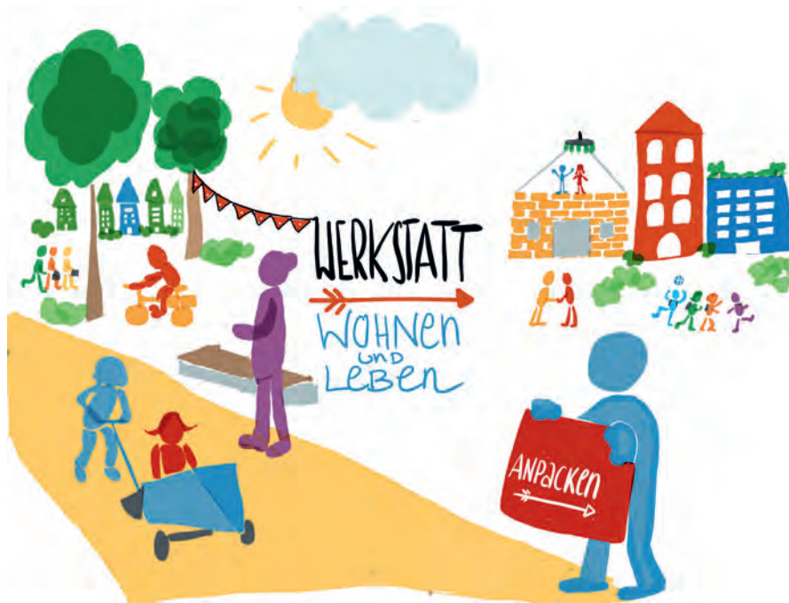
Grafik: Tanja Föhr

In Forum I („Quartier und Integration“) hatten die Teilnehmer herausgearbeitet, dass sich die bestehenden Instrumente - gerade das Quartiersmanagement - bewährt haben und hierzu gute Beispiele aus der Praxis vorgestellt. Dabei sei wichtig, dass die Integration insbesondere in sogenannten Brennpunkten gelebt werde und Beteiligungsstrukturen geschaffen werden, die zu einer Aufwertung und Stabilisierung der Gegenden führen. Im Rahmen des Quartiersmanagement seien im Rahmen einer Sozialraumanalyse die Entwicklungspotentiale zu erkennen und ein integriertes Handlungskonzept samt strategischem Zusammenwirken zu schaffen.