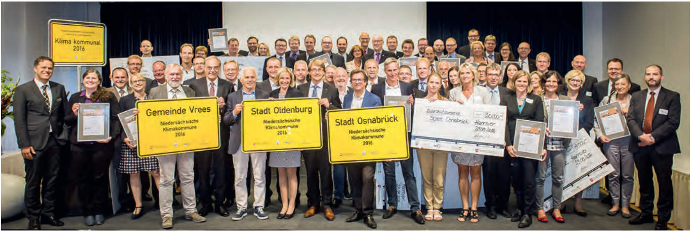
Ende August 2016 hat im Alten Rathaus in Hannover die Preisverleihung des Wettbewerbs „Klima kommunal 2016“ stattgefunden.

Der Landkreis Schaumburg ist für das Projekt „BürgerEnergieWende“ ausgezeichnet worden. Gemeinsam mit dem Verein BürgerEnergieWende e. V. - der einige der wichtigen Aufgaben zur Umsetzung des Klimaschutzkonzeptes in der Kommune wahrnimmt - ist eine noch umfassendere Umsetzung der Klimaschutzmaßnahmen möglich. Zu den sichtbaren Ergebnissen zählt beispielsweise die Gründung einer Energiegenossenschaft für den weiteren Ausbau der regenerativen Energieerzeugung. Diese Zusammenarbeit zwischen Kommune und Bürgerverein zeigt anderen Kommunen im Land, wie sich bürgerschaftliches Engagement positiv in die Verwaltungsarbeit einbinden lässt.